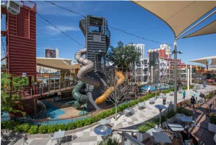
Downtown Container Park Las Vegas

« Entre 2017 et 2020, les enseignes d'Escape Game ont vu leur nombre multiplié par deux, passant de 450 à 850 et ont conquis tous les territoires. »